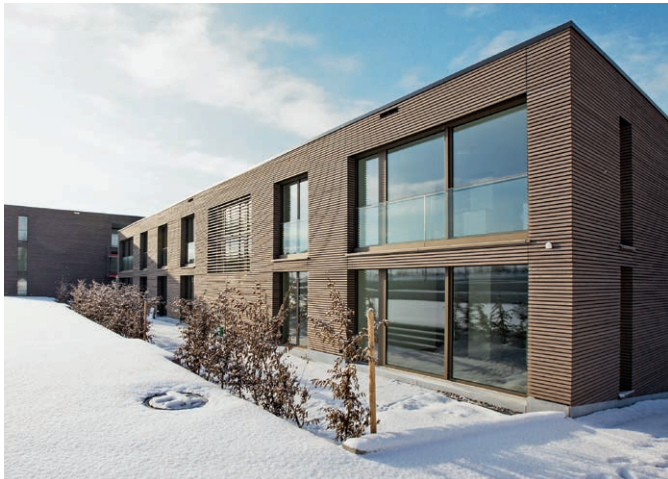
Wohnüberbauung Münsingen Sandacher