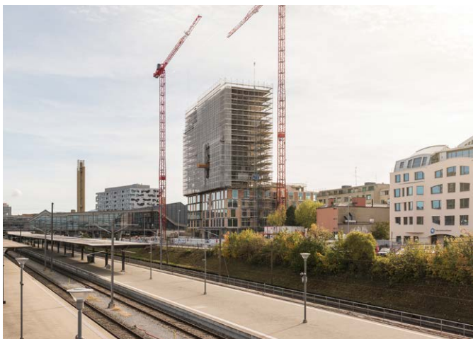
Meret Oppenheim Hochhaus Basel