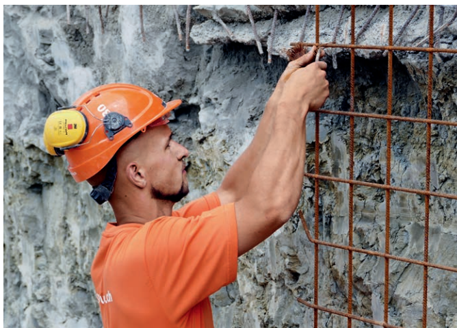
Baugrubenabschluss Migros Zentrale, Gossau ZH