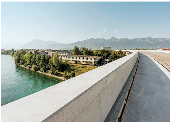
Aarebrücke Bypass Thun Nord