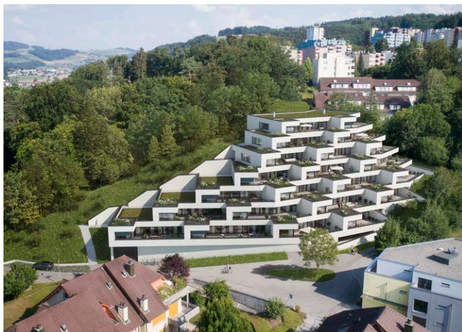
Plateaux de Berne Ostermundigen