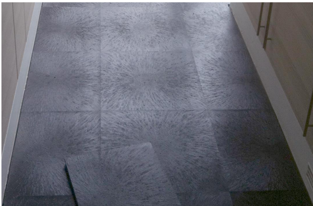
Wohnhaus in Oberried