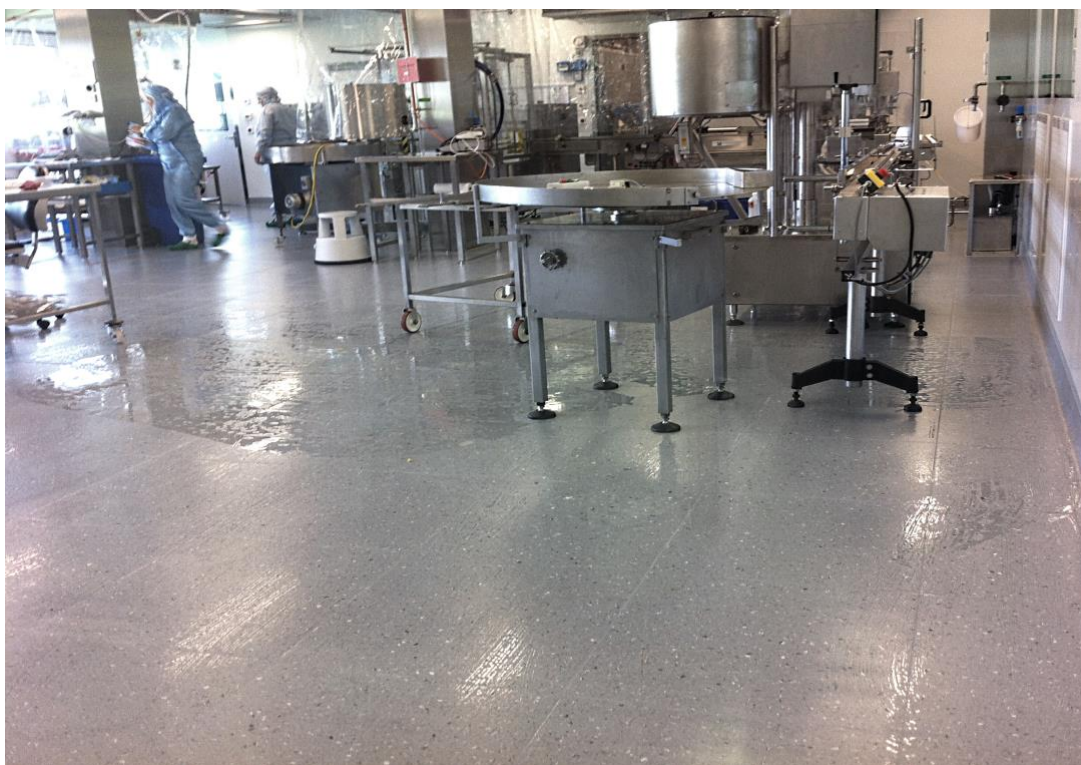
Colorex® plus AS