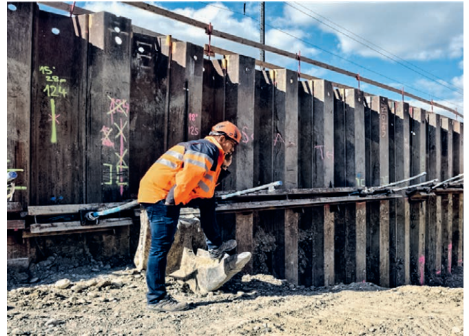
Technische Bauleitung in der Ausführungsphase Begleitung, Überwachung und Qualitätskontrollen

Damit ihr Projekt ein Erfolg wird übernehmen wir für Sie die technische Bauleitung und begleiten ihre Baugrube bis zur Hinterfüllung. Durch die Erstellung fachgerechter Kontrollpläne sowie Überwachungskonzepte schaffen wir Verantwortlichkeiten und erzeugen Struktur für ihren Spezialtiefbau. Anschliessend führen wir für Sie regelmässige Qualitätskontrollen durch und sorgen damit für die nötige Sicherheit ihrer Baugrube.