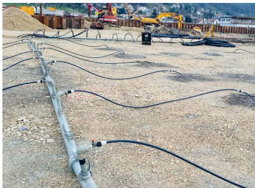
Optimierte Wasserhaltungskonzepte für Baugruben Systemauswahl und hydraulische Berechnungen