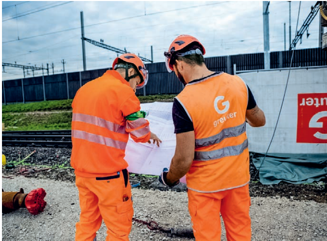
Projekt- & Kundenberatung in der Submissionsphase Auswahl ihres wirtschaftlichsten und sicheren Systems

Für die erfolgreiche Durchführung Ihres Projektes sehen wir uns bereits in der Submissionsphase als ihr idealer Partner. Wir finden individuell für Sie die wirtschaftlichste und statisch sichere Lösung für Ihre Pfählung oder Baugrubensicherung. Weiter begleiten wir Sie durch die Ausschreibung mit der Devisierung nach NPK oder freihändig. Vor Baubeginn erarbeiten wir gemeinsam Ihre massgeschneiderte Nutzungsvereinbarung.