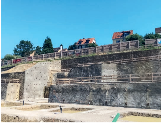
Massgeschneiderte Unternehmervarianten Wirtschaftliche Baugrubensicherungen