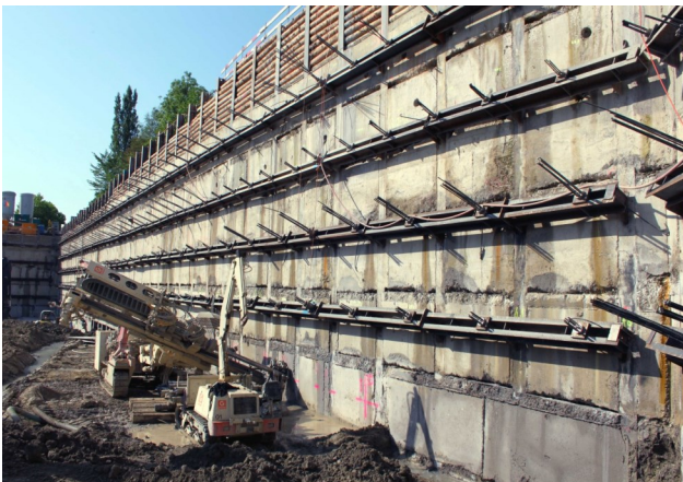
Kilchberg – Neubau Lindt & Sprüngli 11'400 Laufmeter Litzanker bis 22 Meter