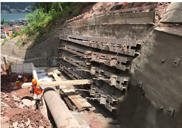
Unterterzen – HWS Chammenbach 770 Laufmeter Litzanker bis 24 Meter