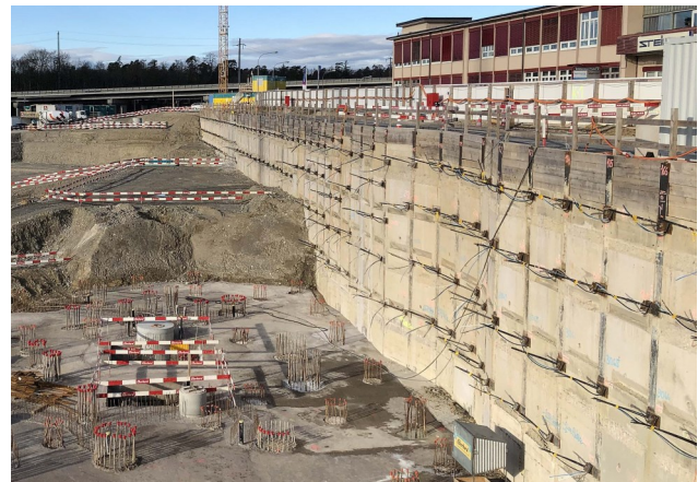
Bülach – Glasi Quartier 9'200 Laufmeter Litzanker bis 18 Meter