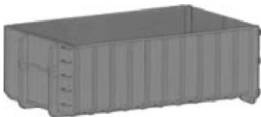
Abrollmulde 17 m 3